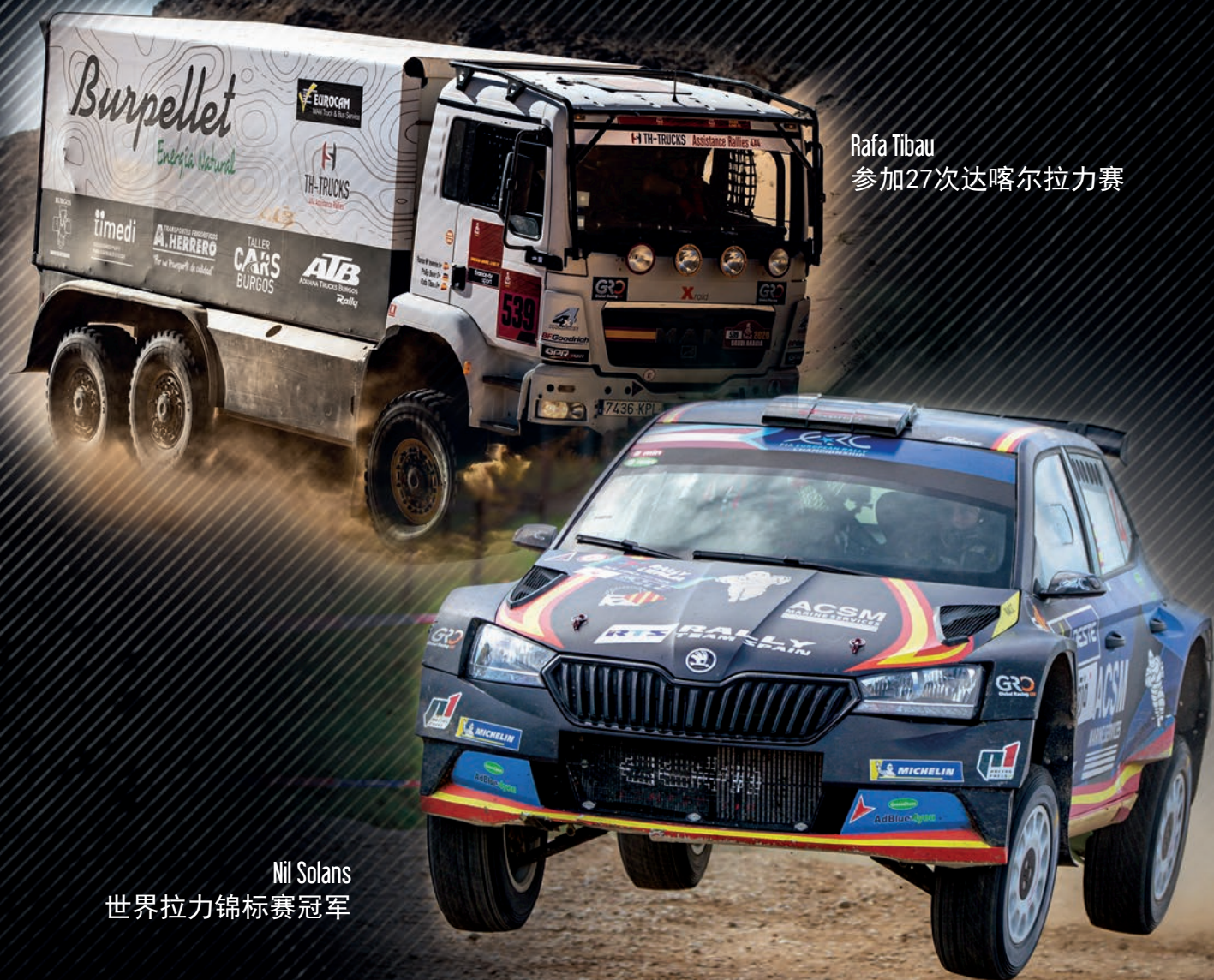
Rafa Tibau 参加27次达喀尔拉力赛